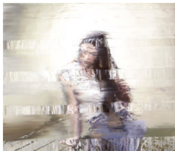
Notre partenaire OPERA GALLERY

Le leasing vous permet de démarcher une nouvelle clientèle de professionnels : Entreprises & Professions libérales. Dès la signature du contrat, nous vous réglons immédiatement.