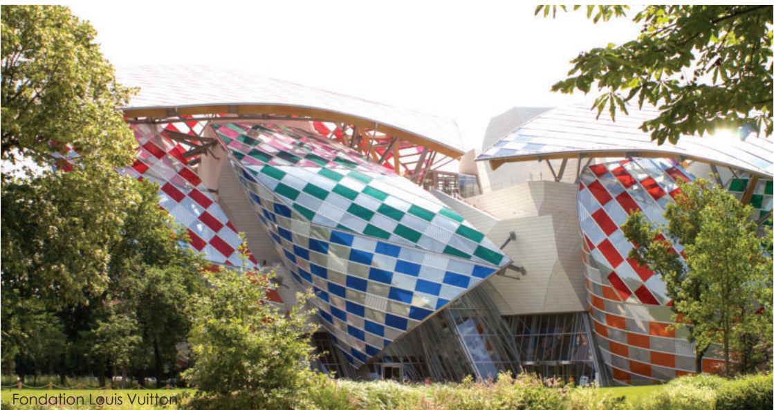
Fondation Louis Vuitton